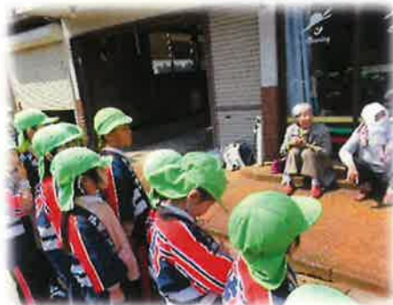
新あけび組の幼年消防クラブ 「火の用心をお願いします!」 (5歳児)