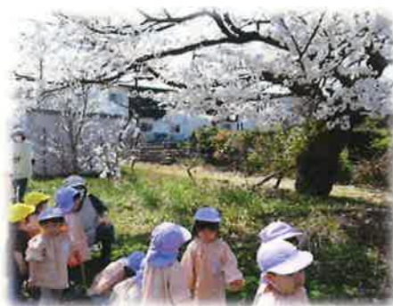
ほかほか陽気の中お出かけ 「桜がきれいだね!」 (2歳児)